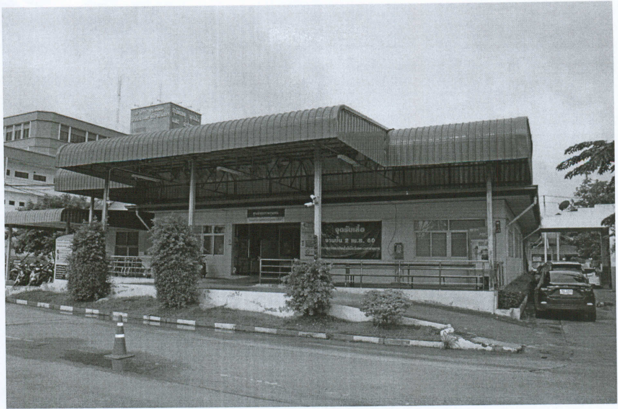
รูปภาพด้านข้างอาคาร(ทิศตะวันออก)