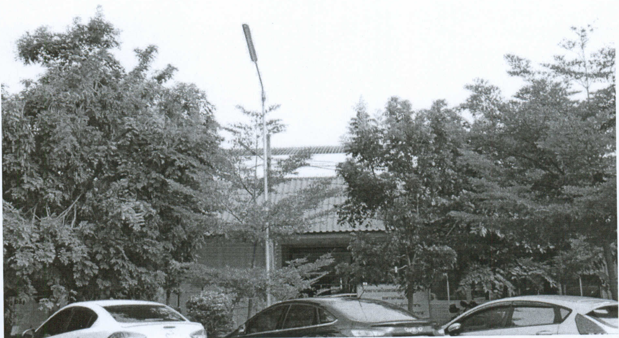
รูปภาพด้านหลังอาคาร