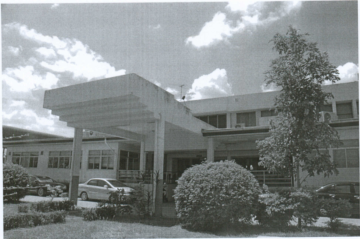
รูปภาพด้านหน้าอาคาร

โรงพยาบาลเทพรัตนนครราชสีมา ตำบลโคกกรวด อำเภอเมืองนครราชสีมา จังหวัดนครราชสีมา