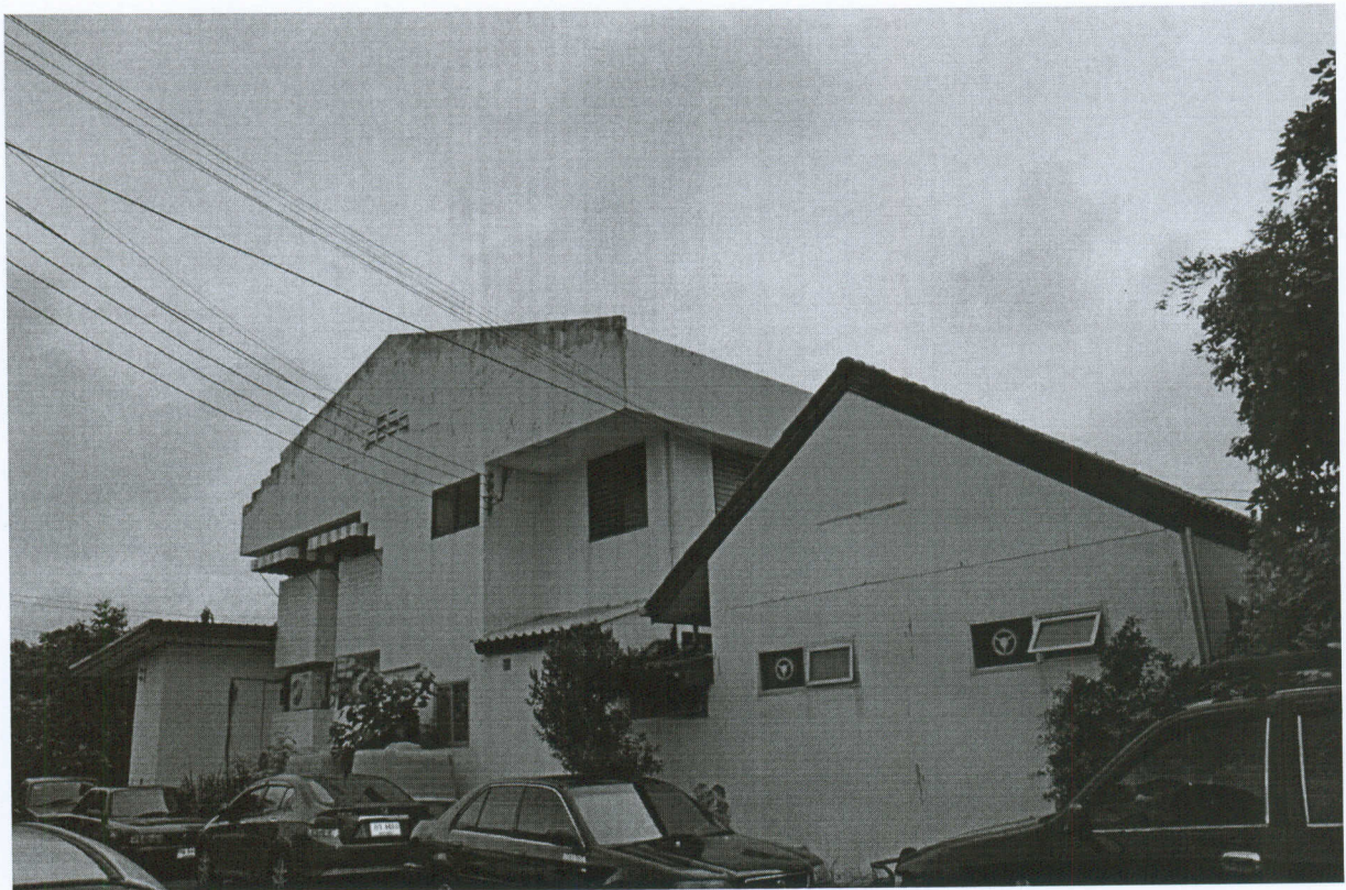
รูปภาพด้านข้างอาคาร (ทิศตะวันตก)