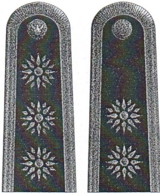
แบบพิเศษ